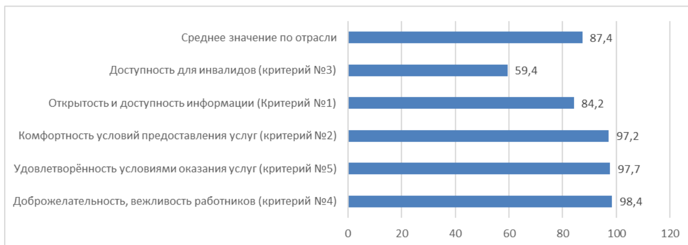
Рисунок – 1. Оценка по отрасли в целом в разрезе общих критериев качества условий оказания услуг образовательными организациями, в баллах

Наибольшее количество недостатков зафиксировано по критерию качества условий оказания услуг в сфере образования «Доступность услуг для инвалидов» (59,4 б.). Ни одна образовательная организация, из числа подлежащих независимой оценке в 2023 году, не обладает в полном объеме необходимыми условиями для обеспечения возможности инвалидам получать услуги наравне с другими; помещения, здания и прилегающие к ним территории организаций полностью не отвечают требованиям доступности для лиц с ограниченными возможностями здоровья.